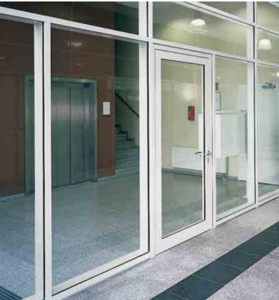
Schüco Firestop T90 / F90 Brandschutztür / -Wandelement Fire door / fire-resistant wall unit