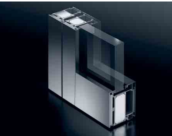
Schüco Firestop T90